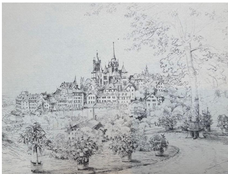
Félix Mendelssohn Bartholdy effectué en 1842

La Cathédrale de Lausanne y est spécialement mise à l'honneur pour célébrer le 750eme anniversaire de sa consécration. D'autres jolies découvertes complètent les propositions 2025. On vous y attend ! Voir flyer annexé.