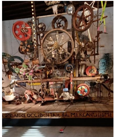
Visite au musée Tinguely Manque-t-il un rouage ?