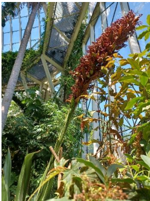
Dorianthe palmeri appelé aussi lys géant. Tarde 40 ans pour fleurir.