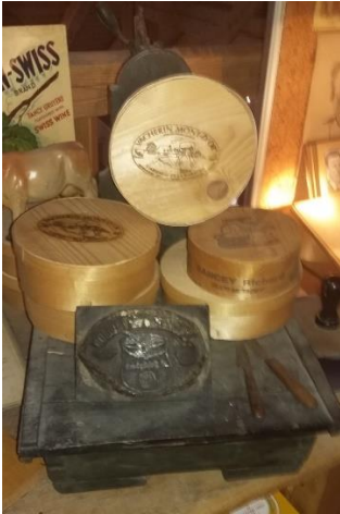
Visite au musée du Mont d'Or De l'art pour valoriser la saveur