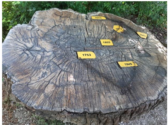
Histoire d'un chêne de 250 ans mort en l'honneur de Rail 2000 (3 ème voie régionale)